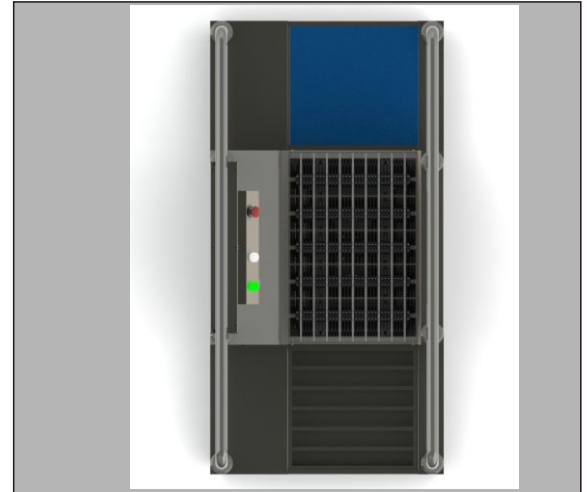
ภาพด้านบน