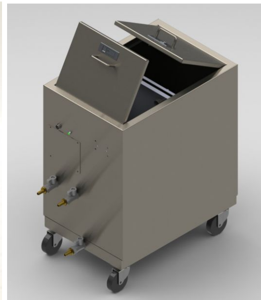
ฝาเปิดแยกกันระหว่าง ถังน้ำกับระบบไฟ